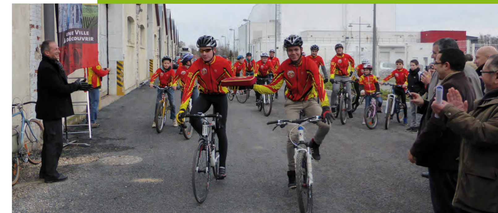
Inauguration de la première tranche de la travée associative dédiée à l'Amicale Laïque de Toul Cyclotourisme, bâtiment B52 - Site de l'Arsenal