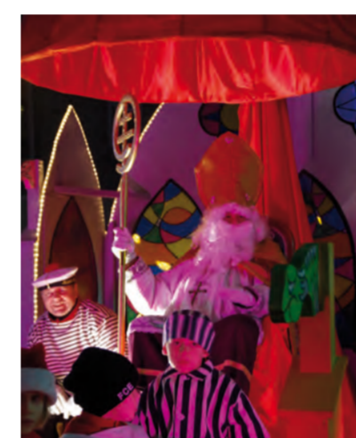
Défilé de Saint-Nicolas