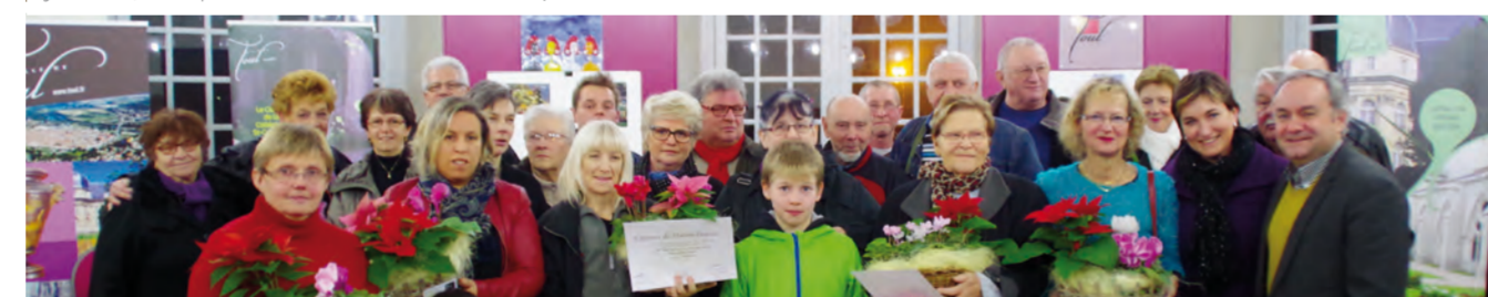
Remise des diplômes des Maisons Fleuries 2013