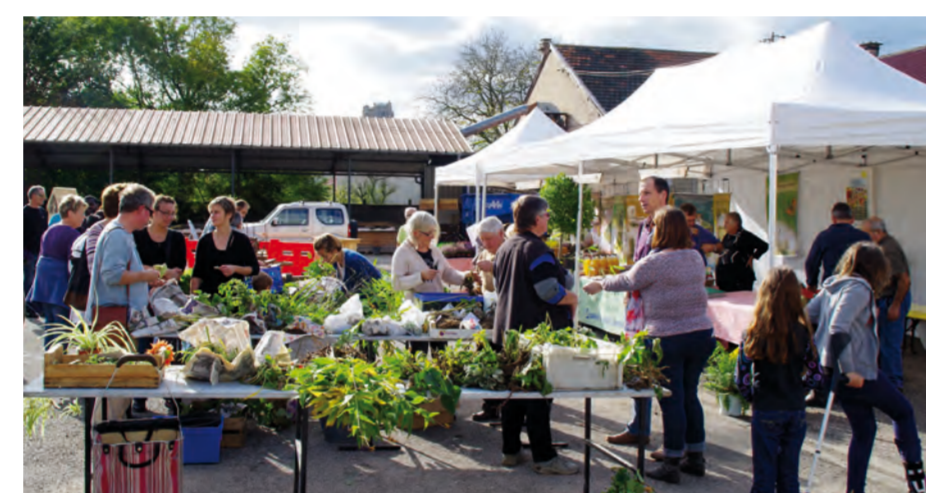
Troc de plantes