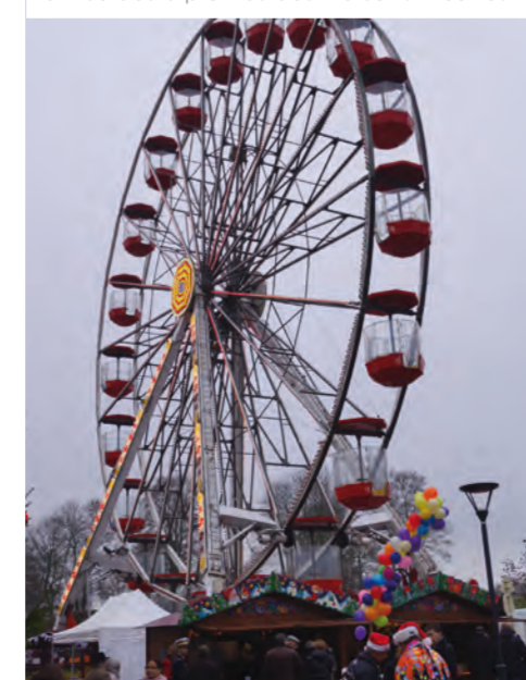
Grande Roue, Cours Raymond Poincaré