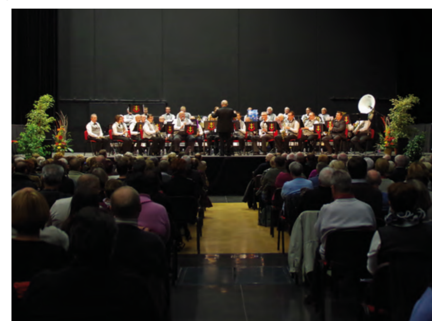
Concert de Sainte-Cécile, Salle de l'Arsenal